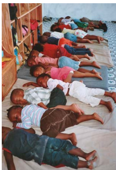
Na de lunch even slapen

Na de lunch worden alle 2-3 jarigen en 4-6 jarigen op matjes gelegd en gaan ze slapen of wat rusten. Bij de baby's – 1 jarigen loopt alles via een ander schema omdat daar de kinderen op eigen tijden slapen. Ondertussen wordt er afgewassen, waarbij je goed moet opletten, dat je op tijd de bak met water onder de afvoer leegt, want er is geen normale afvoer in de keuken. Ook wordt alles weer opgeruimd en wordt er geveegd. En daarna is het wachten op de ouders of oudere broers/zussen, die de kinderen komen ophalen.