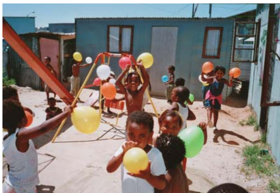
De ballonnen zijn een succes!