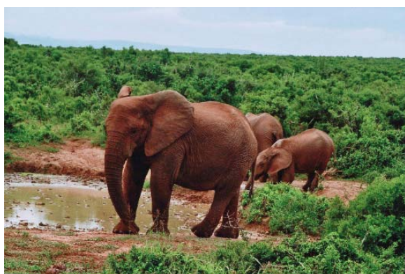
De olifanten in Addo Elephant Park

's-Middags gaan we naar Schotia wildpark waar we met een 4-wheeldrive jeep in het park worden rondgereden. Hier zien we Wildebeesten, Zebra's, Hartebeesten, Giraffen, Springbokken, Gemsbokken, Impala's, de neushoorn en leeuwen. Zoveel verschillende wilde dieren op een dag zien is echt helemaal te gek.