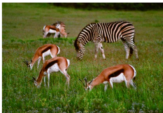
Springbokken en een Zebra in Schotia Wildpark