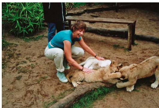
De leeuwjes aaien

Ook zien we leeuwjes van 3 ½ week oud; heel schattig om te zien.