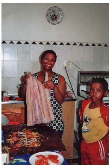
Baie lekkere snoek in Melkhoutfontein